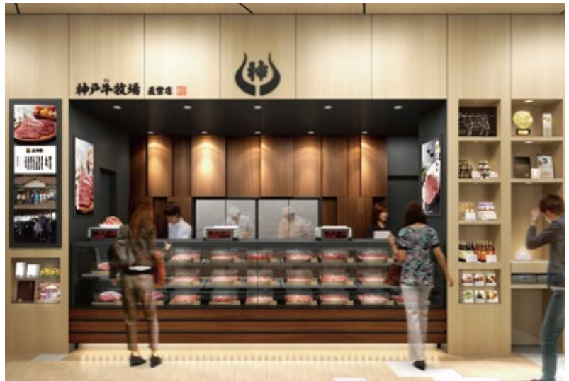
お客様と肉職人が直接お話しできるよう、売場と加工場をつなぐ窓をご用意。