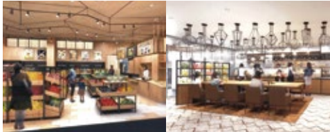
ファーマーズマーケット、地元食材を扱うデリカフェも。