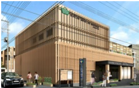
新鮮な牛肉と野菜、お米などが買える「マチマルシェ御影」。